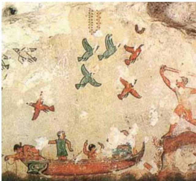
Tomba della Caccia e della Pesca (520 a.C.) - particolare

Siamo particolarmente orgogliosi che la Città di Tarquinia sia la protagonista della bella manifestazione “Velimna: gli Etruschi del fiume”, organizzata dall’associazione Pro-Ponte ed ormai giunta alla quinta edizione.