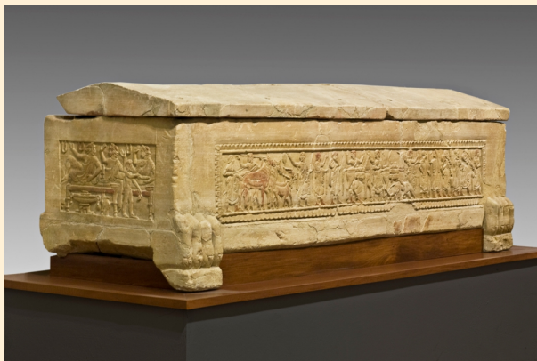
Sarcofago in pietra arenaria detto dello Sperandio; 510-500 a.C. Perugia, Museo Archeologico Nazionale dell'Umbria.