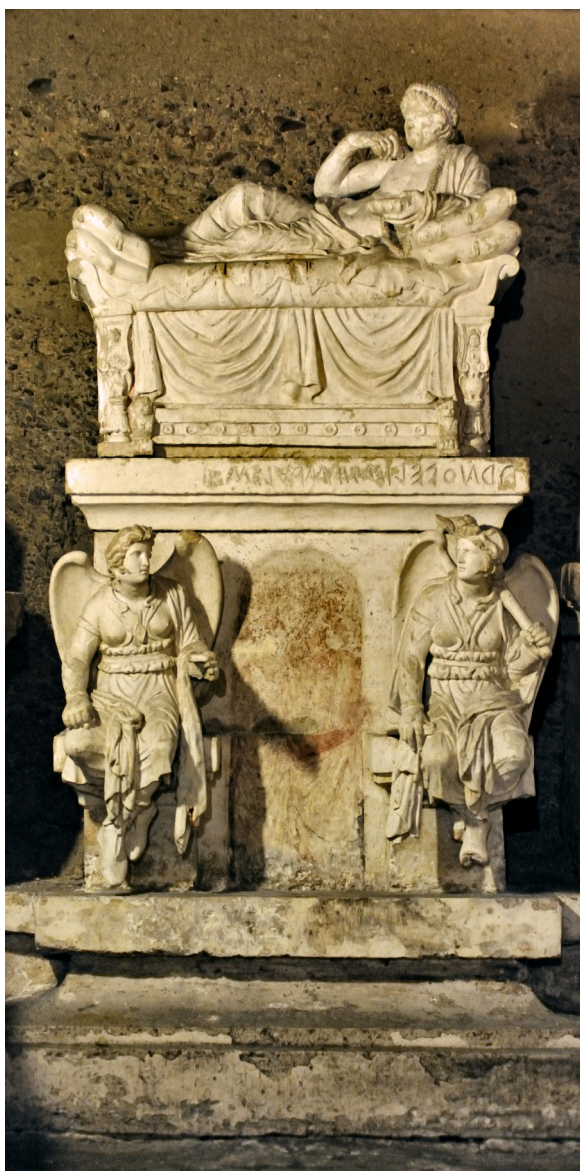
Urna di Arnth Velimna - Ipogeo dei Volumni