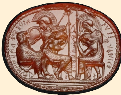
Gemma da Perugia con mito Sete contro Tebe 500-480 a.C., Berlino