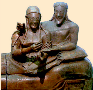
«Sarcophago Degli Sposi» Urna Funeraria in Terracotta Policroma Necropoli della Banditaccia Cerveteri Tardo VI Sec. a.C. Museo Nazionale Etrusco Villa Giulia (Roma)

Assessore alla Cultura, Turismo e Università del Comune di Perugia