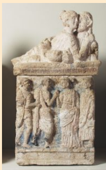
«Urna del Bacio Perugino»

Museo archeologico Nazionale e teatro romano di Spoleto