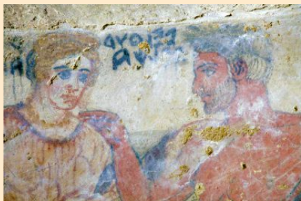
Particolare Tomba degli scudi Tarquinia