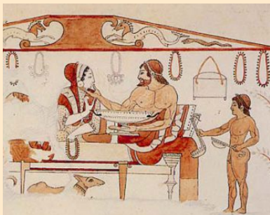
Tombe dei vasi dipinti Tarquinia - fine del VI secolo a.C.