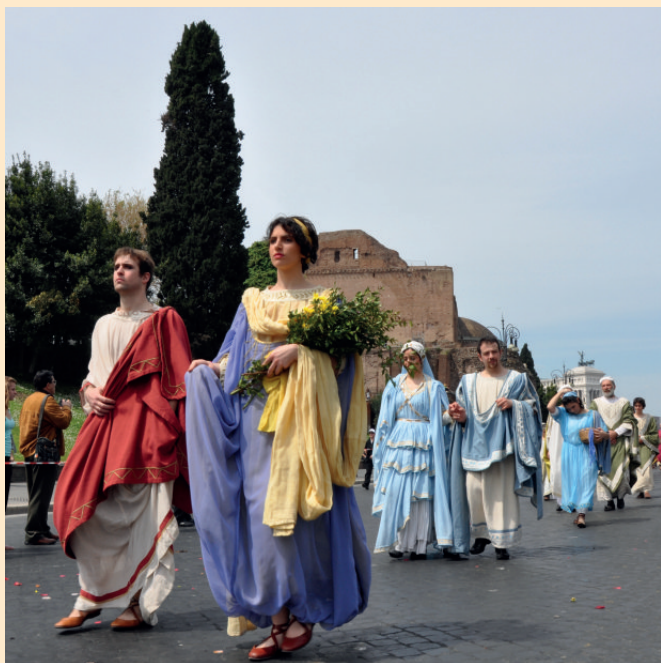
I Velimna al Natale di Roma - Via dei Fori Imperiali, Roma