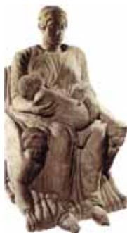
Statua-Cinerario della "Mater Matuta" dalla Necropoli della Pedata di Chianciano Terme V sec. a.c. - Firenze, Museo Archeologico